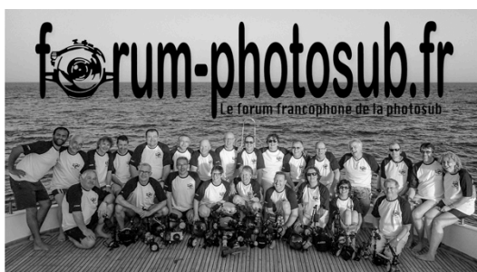
CROISIÈRE BROTHERS -NORD MAI 2016

La croisière Nord, spéciale épaves a été quelque peu modifiée pour s'adapter aux conditions climatiques, mais le requin renard était au rendez-vous, petit final avec les dauphins. Comme d'habitude une très bonne ambiance, de belles photos, des vidéos sympas, des apéros à gogo. Mais aussi, une analyse des photos et des niveaux ont été validés.